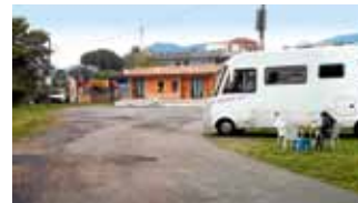
Sizilien: Neben Taormina liegt die Gemeinde mit neuen Plätzen.