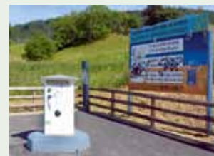
Kommunal: Die Service-Station liegt 100 Meter entfernt.

Wer mit dem Schiff von Estavayer-le-Lac nach Neuchâtel fährt, sollte vorab etwas Zeit für die immer noch recht mittelalterlich anmutende Kleinstadt mit ihren Toren und Türmen, ihren verwinkelten Gassen und ihrem imposanten Schloss einplanen. Etwa eineinhalb Stunden dauert die Fahrt von Estavayer-le-Lac nach