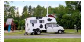
Kopparberg: die Stellplätze auf der Ferien- und Freizeitanlage.

Standort: Kata Dalströms Väg 42, GPS 59°51'50"N, 15°01'55"O. Info: Felicitas Nowak, Telefon 00 46/7 38 29 28 05, E-Mail bko@fjalltofjell.de, http://swe.fjalltofjell.de