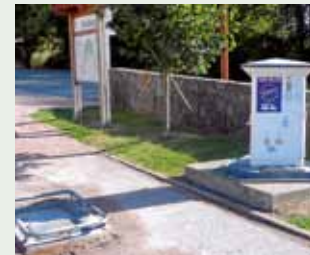
Saubere Sache: Die Euro-Relais-Station am Stellplatz.