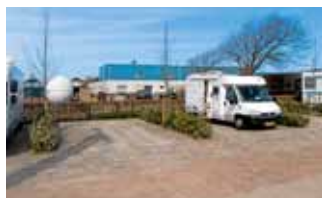
Den Helder: Gleich neben dem Platz ankern alte Schiffe.

Standort: Willemsoord 47, GPS 52°57'45"N, 04°46'14"O. Info: Telefon 00 31/2 23 61 61 00, E-Mail info@willemsoordbv.nl, www.willemsoordbv.nl