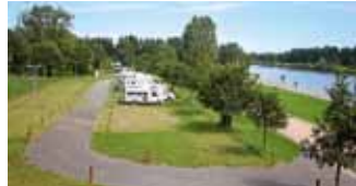
Stolzenau: Jetzt gibt es noch mehr Platz am Weser-Ufer.

Standort: Weserstraße, GPS 52°30'35"N, 09°04'51"O. Info: Gemeindeverwaltung, Telefon 057 61/7 05 10, E-Mail gerd.schrapel@stolzenau.de, www.stolzenau.de