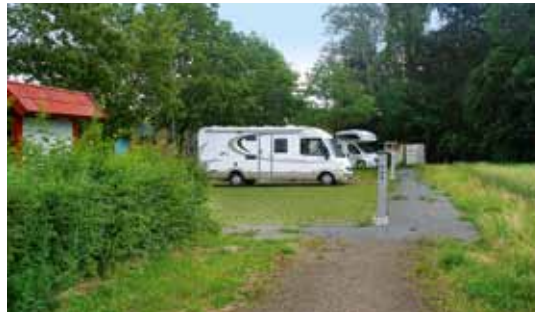
Rodewald: die Stellplätze in der Nähe des Naturerlebnisbads.