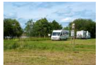
Hörsten: die Stellplätze beim Flugplatz Schachtholm am Kanal.