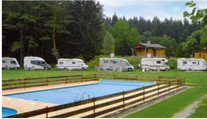
Červená Řečice: Reisemobile stehen hier direkt am Pool.

Standort: A 2, Ausfahrt Moustheni, GPS 40°51'10"N, 24°08'44"O. Info: Telefon 00 30/25 92 02 15 55, E-Mail vikchris@otenet.gr