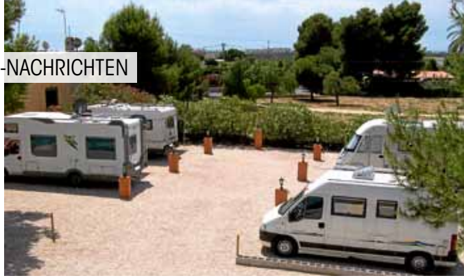
Elche: eingezäunt und geschützt mitten in der Stadt.

➤ 87645 Schwangau/D8. Unter dem Namen Wohnmobilpark Schwangau gibt es neben dem Campingplatz mit separater Zufahrt einen neuen Stellplatz für 24 Mobile am Bannwaldsee. Restaurant, Pizzeria und Minimarkt am Platz. Gebühren: 17,50 Euro pro Nacht und Mobil inklusive Dusche, Ver- und Entsorgung, 12,50 Euro in der Nebensaison. Kurbeitrag: 1,45 Euro/Person. Strom (24 Anschlüsse, 16 Amp.): 2,50 Euro. Hund: 2 Euro. V+E für Durchreisende: 5 Euro. Ganzjährig nutzbar. Standort: Münchener Straße 151, GPS 47°35'31"N, 10°46'24"O. Info: Telefon 0 83 62/9 30 00, E-Mail info@camping-bannwaldsee.de, www.camping-bannwaldsee.de