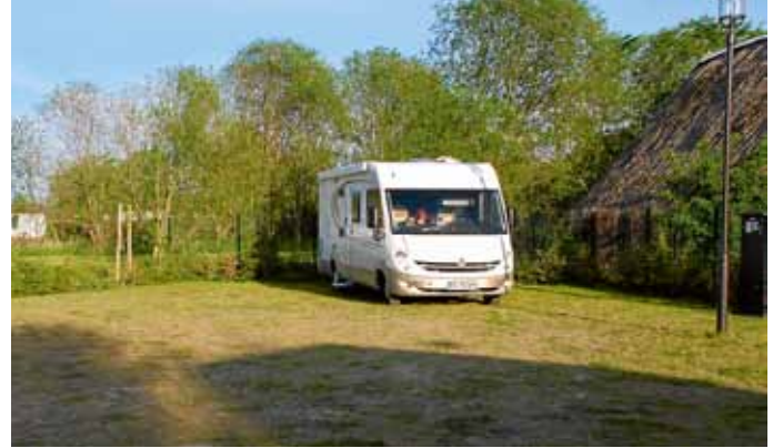
Neukalen: der eingezäunte Stellplatz auf einem Wiesengelände.

31637 Rodewald/D3. Die Region Mittelweser, zwischen Minden und Bremen gelegen, wird für Reisemobilisten immer interessanter. Jetzt wurde im zweitlängsten Dorf Niedersachsens (zwölf Kilometer lang) der jüngste Platz mit elf Stellplätzen in der Region eingerichtet. Sechs Mobile finden auf dem mit Rasengittersteinen befestigten Gelände Platz, jeder verfügt über Stromversorgung, und 50 Meter vor der Anlage gibt es eine Holiday-Clean-Station mit Wendefahrspur am Feuerwehrhaus. Super-