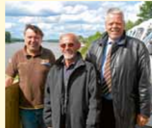
Die Macher: Betreiber, Platzwart und Bürgermeister (v. l. n. r.).