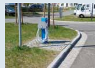
Dezentral: Versorgung am Platz – Entsorgung im Hafen.

diesem schönen Gartenensemble am Rande der Innenstadt gehören so wertvolle Bauten wie die neugotische Schlosskirche, die klassizistische Orangerie, der Marstall, der Hebetempel und die Gedächtnishalle für Königin Luise von Preußen. Hier wandelt der Besucher auf