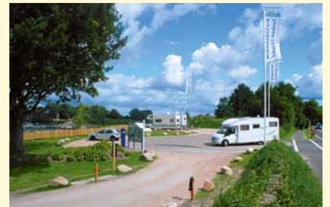
Der Empfang: Am Rondell gibt es eine Infotafel mit Kassensautomat, fünf Pkw-Plätze und oberhalb weitere Stellplätze.

chen und ergänzen im Zubehörshop ihre Ausrüstung. Und wenn's mal brennt, kommt der Service auch auf den Platz.