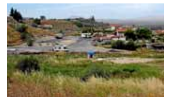
Korinth: ausschließlich für Reisemobile angelegtes Gelände.

Standort: keine Straßenangaben, GPS 37°54'42"N, 22°52'40"O. Info: Spiros Pantazis, Telefon 00 30/27 41 02 73 33, Mobil 00 30/69 49 73 16 65, E-Mail camperstop.afroditeswaters@hotmail.com, www.camperstop.gr